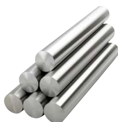
Pístní tyče, trubky a příslušenství