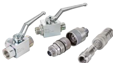
Rychlopojky, kulové kohouty